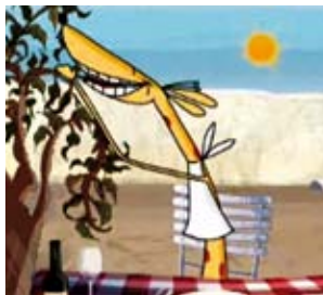
Une Giraffe sous la Pluie – Belgien 2008. R: Pascale Hecquet, Animationsfilm. > www.filmbuero-saar.de

Eine Möglichkeit, über die Grenzen und den Tellerrand zu schauen und den Alltag mit anderen Blicken zu betrachten.