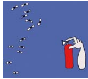
Terror – Deutschland 2008. R: Mert Akbal, Animationsfilm. > www.filmbuero-saar.de