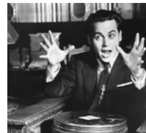
USA 1994. R: Tim Burton, B: Scott Alexander, Larry Karaszewski, Rudolph Grey, M: Howard Shore, K: Stefan Czapsky, Schn: Chris Lebenzon, D: Johnny Depp, Martin Landau, Sarah Jessica Parker, Patricia Arquette, Jeffrey Jones, 121 Min, FSK ab 12

und als Spezial ein Film von Ed Wood: Bride of the Monster